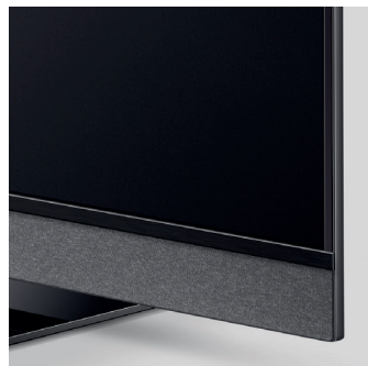
Graphitgraues Akustikvlies mit Zierblende aus gebürstetem Aluminium in Schwarz Brillant und umlaufendem schwarzen Aluminiumrahmen.