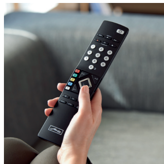
Die übersichtliche Fernbedienung RM18 in Schwarz findet ihr Gegenstück im ebenso aufgeräumten Menü.