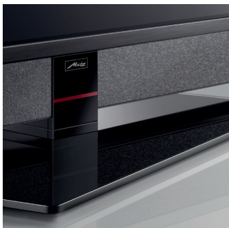
Der formschöne drehbare Glasfuß in Schwarz verleiht ihm stabilen Stand.

Mit seinem Direct-LED-Display in UHD-Auflösung und 400 MetzVision-Technologie verspricht der CUBUS ein bemerkenswert scharfes Fernseherlebnis. Lokal abschaltbare Dimmzonen sorgen für optimierte Kontrastleistung und tragen zur Energieeffizienz bei. Ein Twin-Multi-Tuner und zwei CI+ Schnittstellen rüsten ihn zum Free- und Pay-TV-Empfang auf allen Empfangswegen. Für glasklare Höhen und satte Bässe sorgt die MetzSoundPro-Technologie mit gekapseltem 2-Wege-System und Bassreflex-Kanal, die den Ton mit sechs nach vorne abstrahlenden Lautsprechern zum Leben erweckt. Eine umfangreiche Schnittstellenausstattung sowie WLAN und Bluetooth® machen ihn zu einem vielseitigen Alleskönner. Über sein vollumfängliches USB-Recording läuft der TV beim Anschluss eines externen Datenträgers mit Timeshift- und Aufzeichnungsfunktionen zur Höchstform auf.